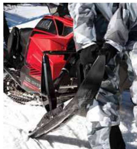
Yamaha har valt Dual Keel-skidorna med dubbla kölar vilket fungerar mycket bra på den här Vipern.

handen i handsken för denna typen av skoteråkning med gott om kraft över hela registret. Som vanligt är den lite het på gröten i starten men väl uppe i fart växlar den perfekt med bra backshift och kraft ut ur kurvorna. Värme i dynan kan låta överdrivet men när temperaturen faller finns det inget skönare än att höja effekten från Low till High och njuta av att värmen sprider sig. Naturligtvis har den även saker som hand- och tumvärmare, dessutom sitter bekvämligheter som el-start och back också på plats.