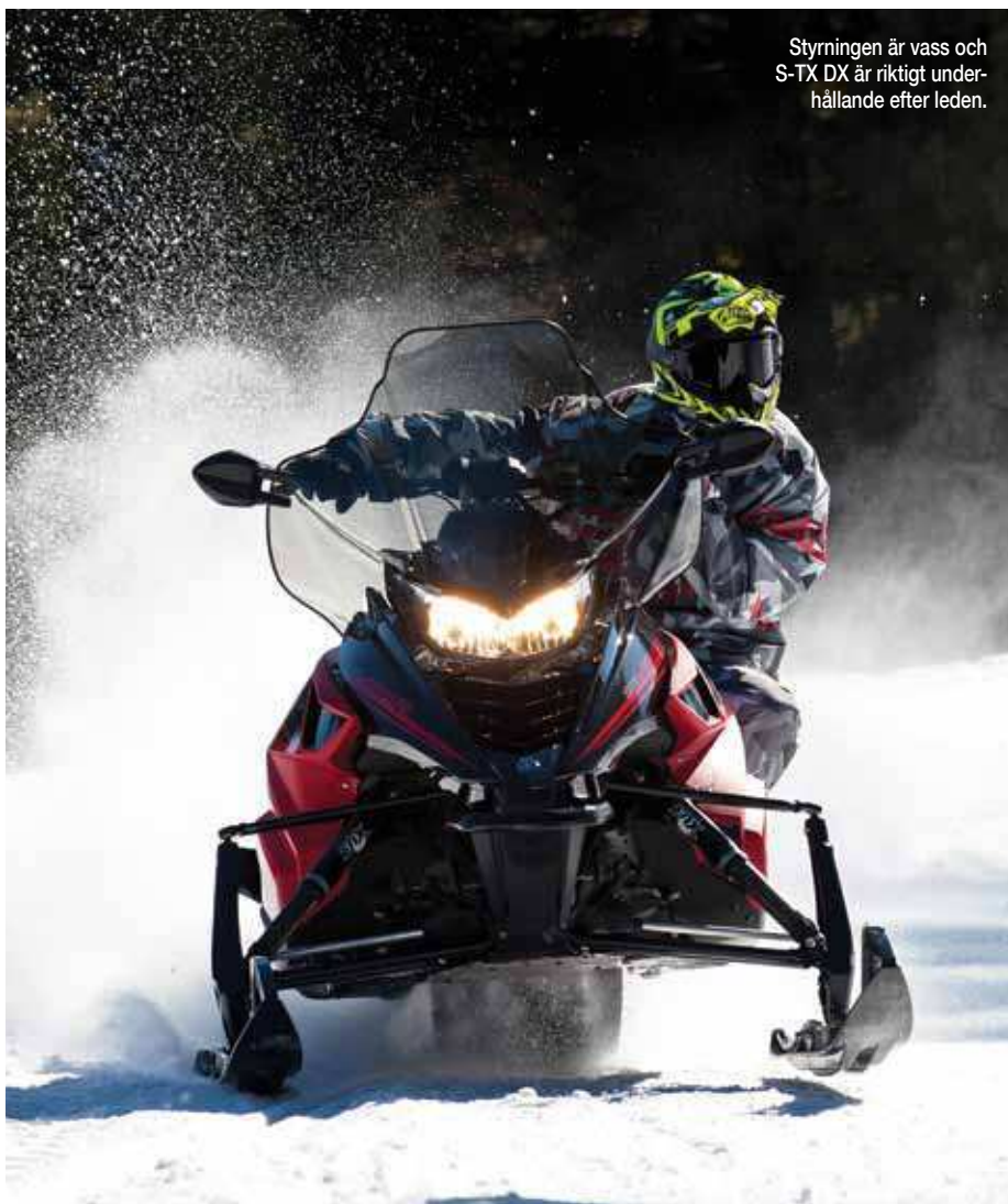
Styrningen är vass och S-TX DX är riktigt underhållande efter leden.