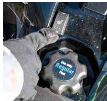
Värme i dynan kan verka överdrivet men fungerar riktigt bra när det är kallt ute.